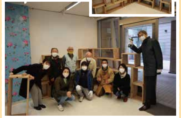
完成した棚の前でパチリ♪